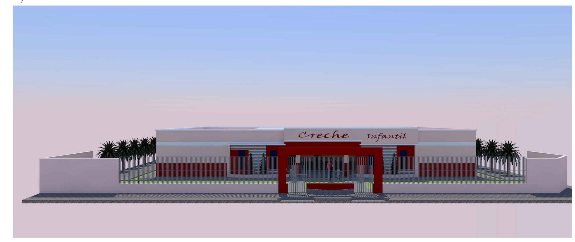
FACHADA FRONTAL PROJETO ARQUITETÔNICO