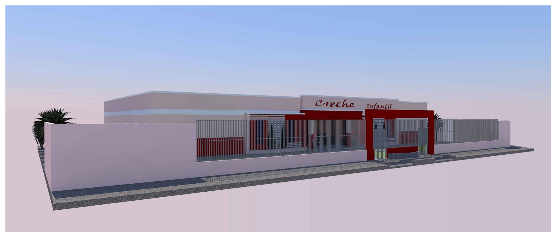
FACHADA PERSPECTIVA PROJETO ARQUITETÔNICO