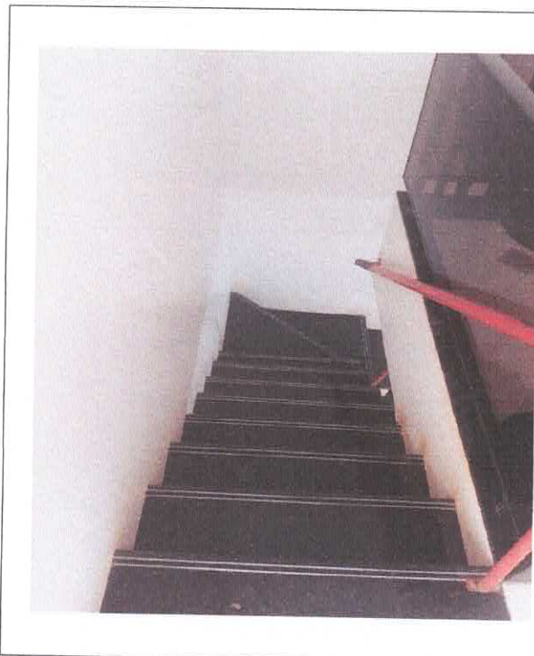
FOTO DA ESCADA DE ACESSO AO ANDAR SUPERIOR