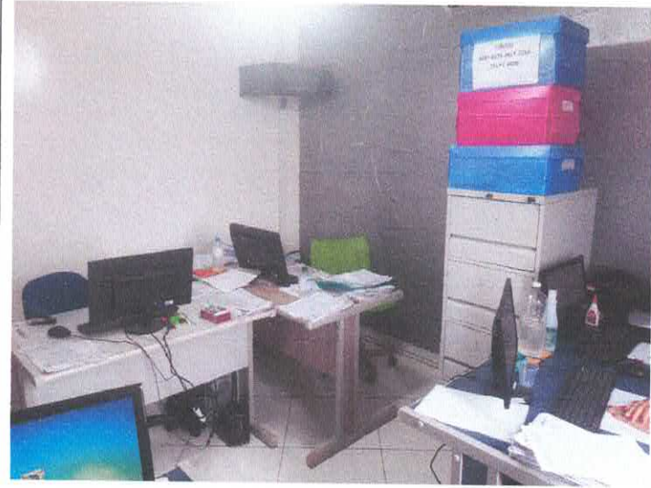
FOTO DE UMAS DA SALA DO ANDAR SUPERIOR