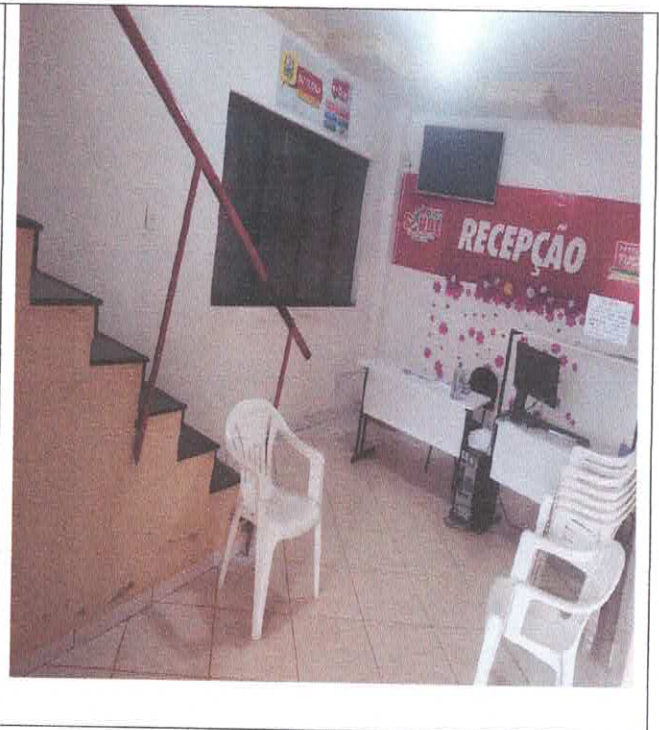
FOTO DA RECEPÇÃO