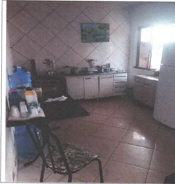
FOTO DA COZINHA