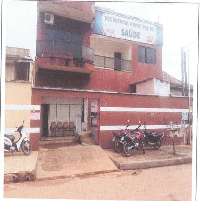
FOTO DA FACHADA DO IMOVEL