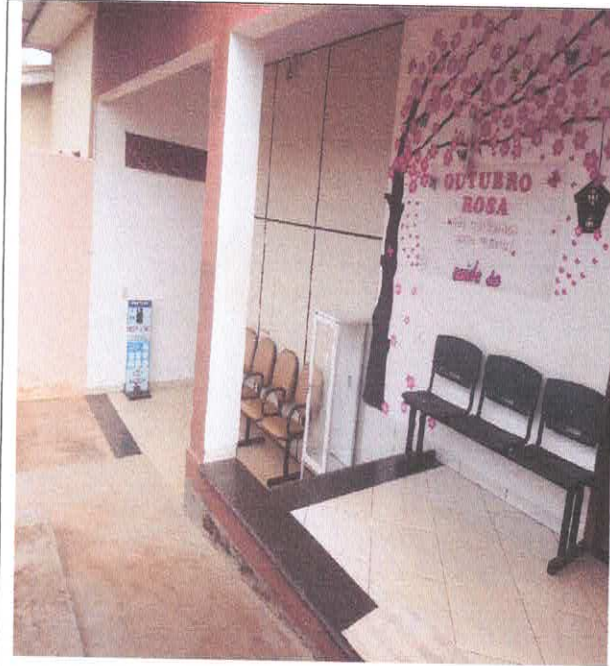
FOTO DA ENTRADA