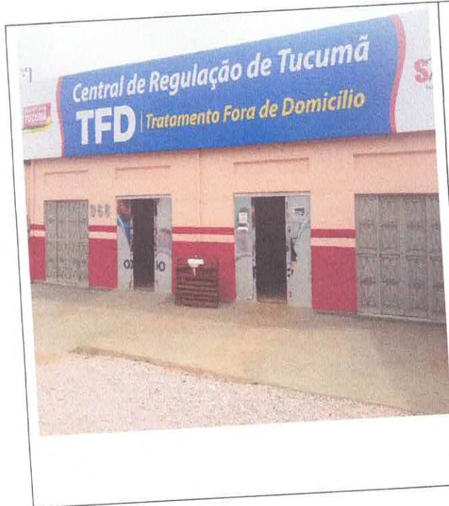
FOTO DA ENTRADA