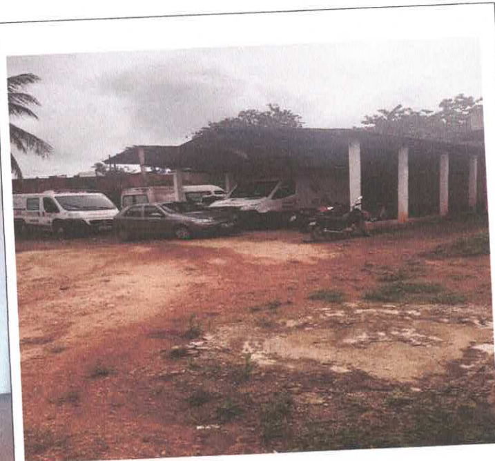
FOTO DO ESTACIONAMENTO