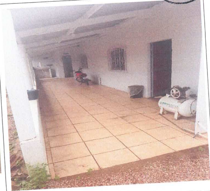
FOTO DA ÁREA EXTERNA