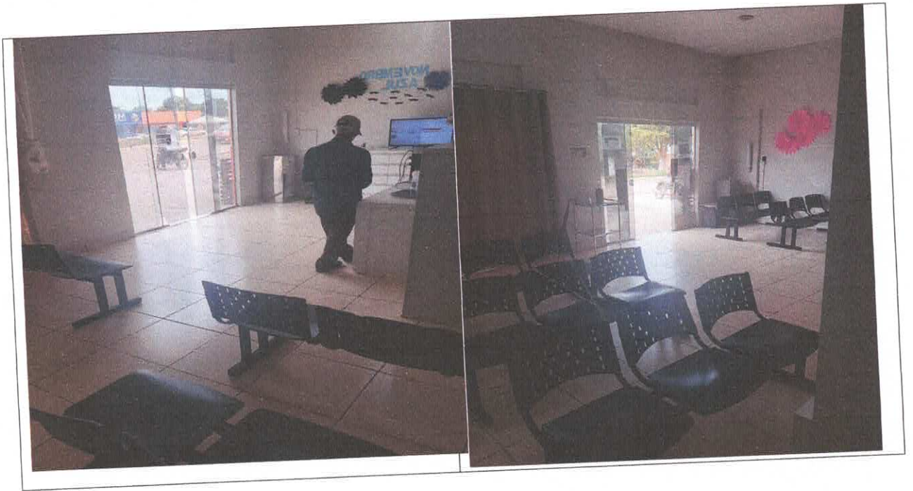
FOTO DA RECEPÇÃO ODONTOLÓGICA