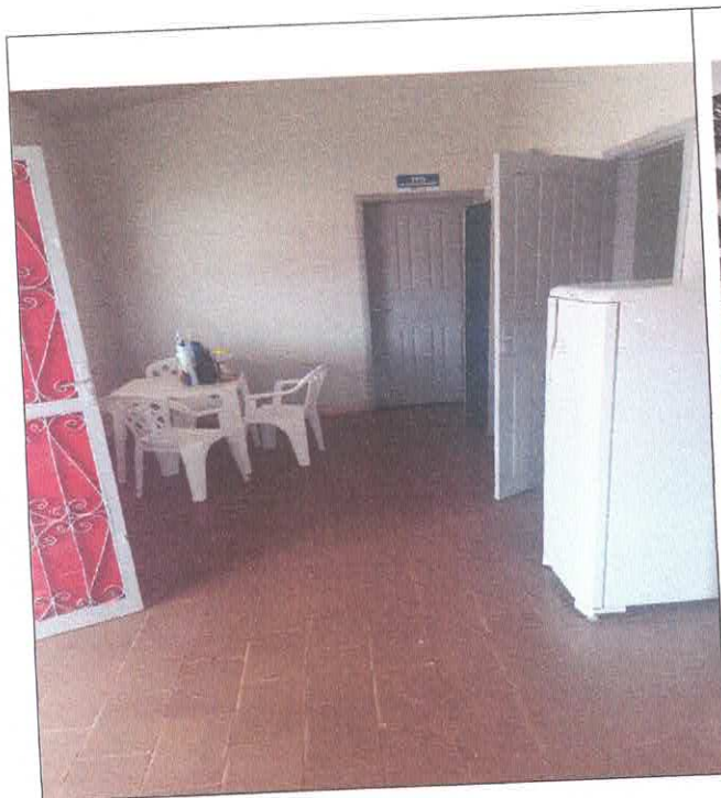
FOTO DA COZINHA