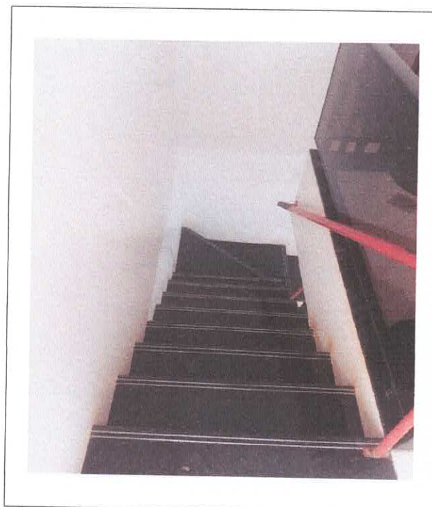
FOTO DA ESCADA DE ACESSO AO ANDAR SUPERIOR