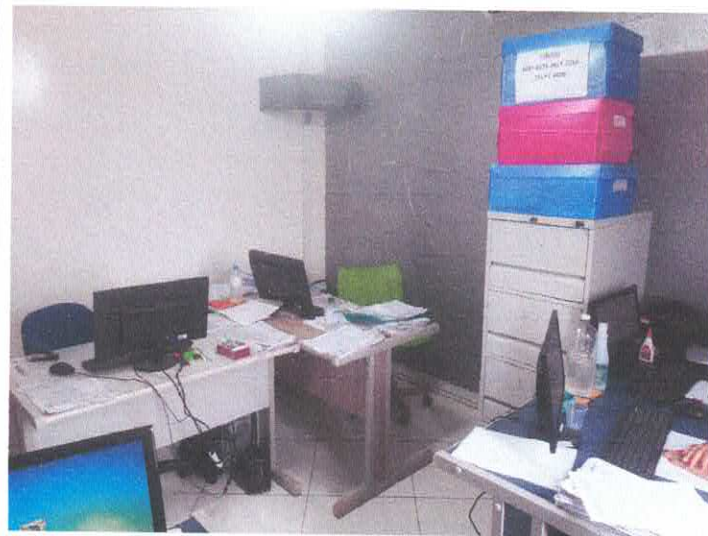
FOTO DE UMAS DA SALA DO ANDAR SUPERIOR