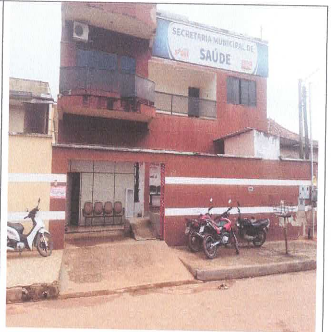
FOTO DA FACHADA DO IMOVEL