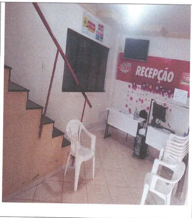
FOTO DA RECEPÇÃO