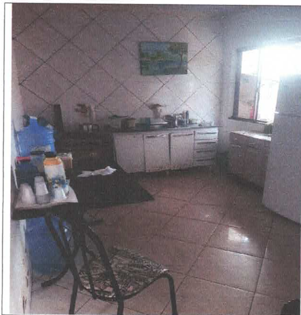
FOTO DA COZINHA