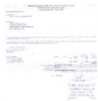
Imagem (20).jpg 198K