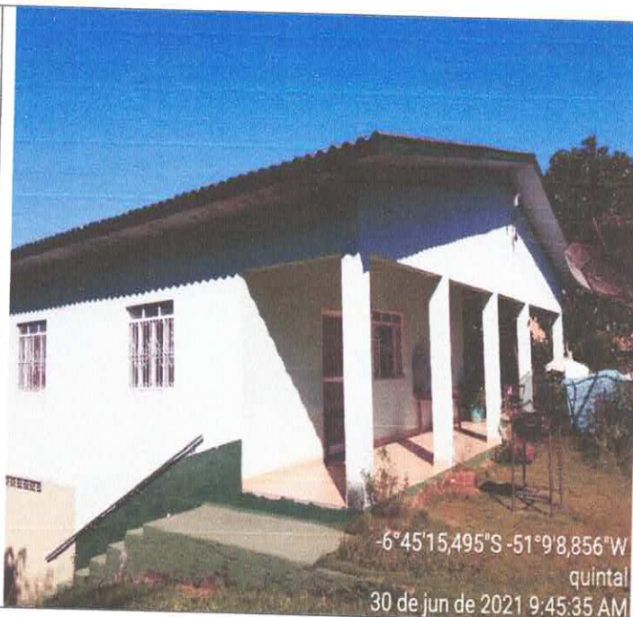
FOTO DA AREA EXTERNA DA CASA