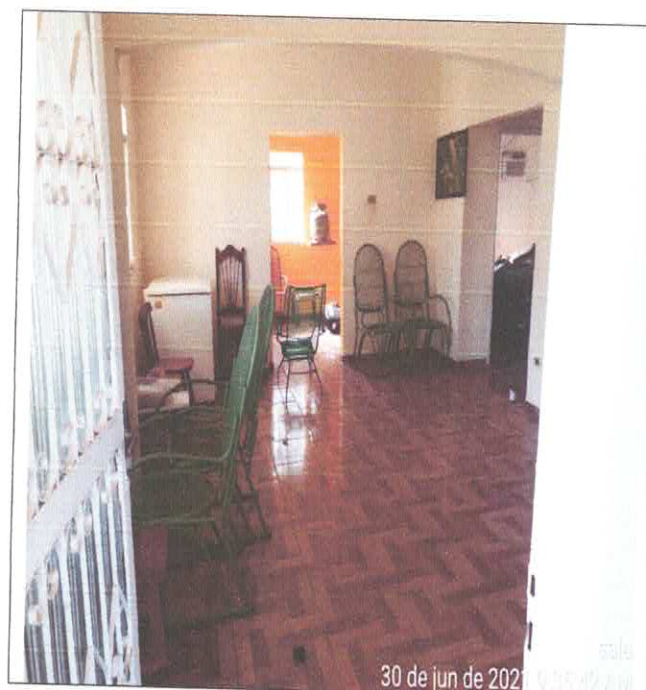
FOTO DA SALA DA CASA