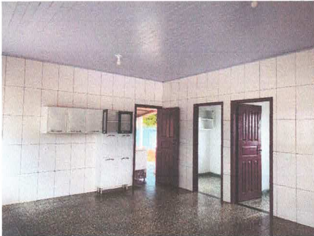
FOTO 08 COZINHA