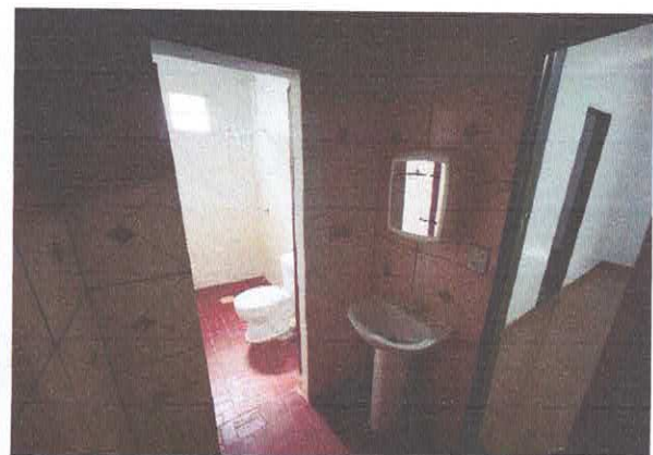
Figura 8: Banheiro social