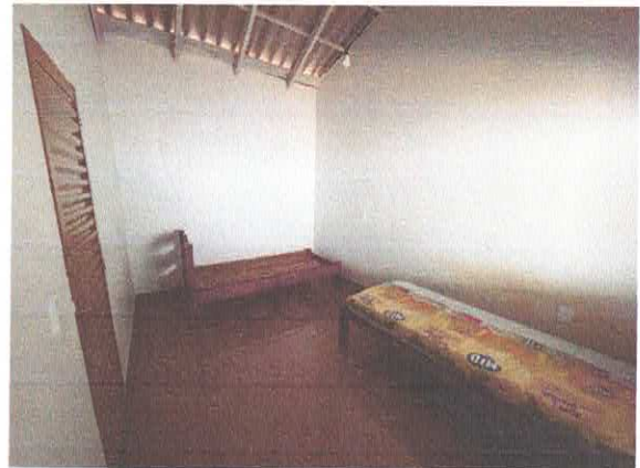
Figura 6: Quarto