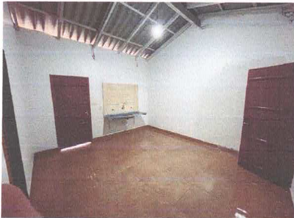
Figura 5: Cozinha