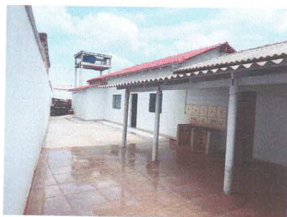
Figura 11: Lavanderia