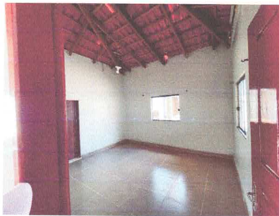
Figura 9: Suíte