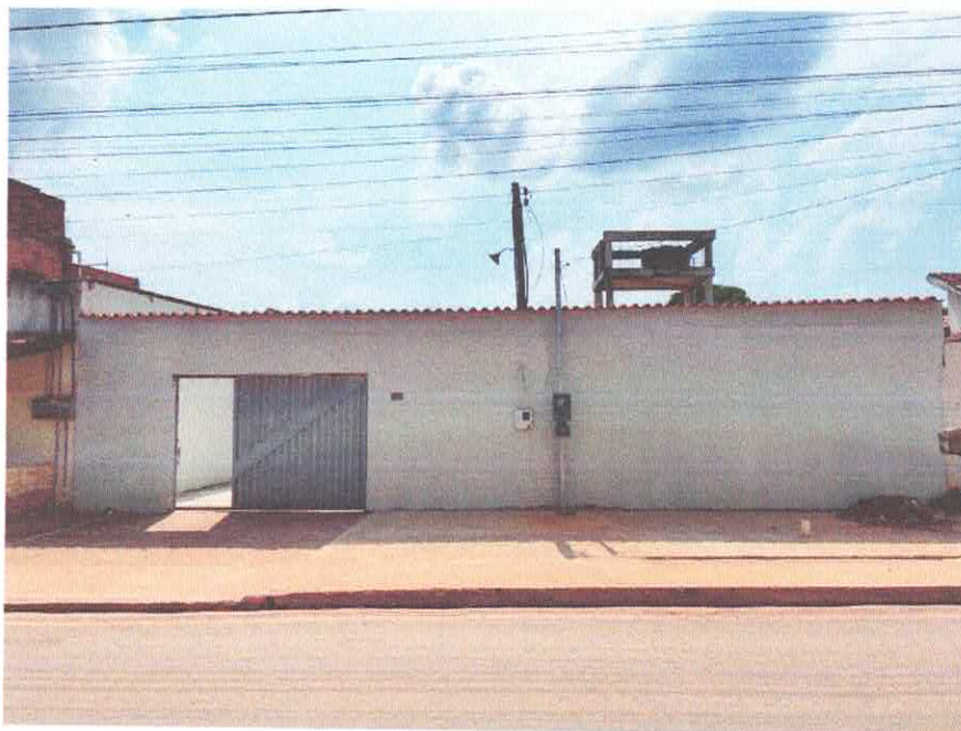
Figura 1: Fachada Principal da Edificação