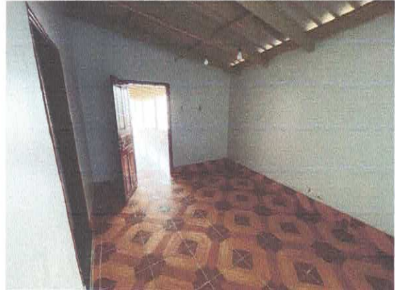
Figura 4: Quarto com acesso a garagem.