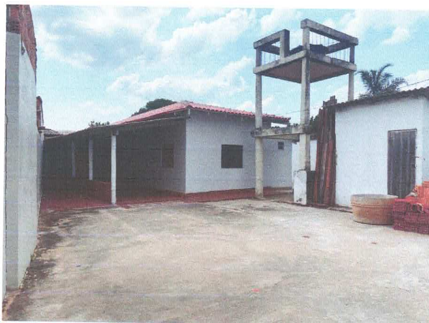
Figura 2: Fachada Frontal