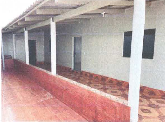
Figura 3: Garagem.