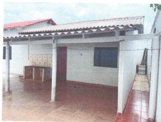
Figura 12: Corredor posterior