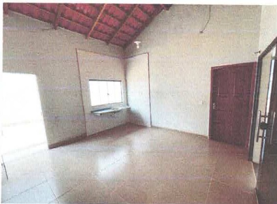
Figura 7: Cozinha