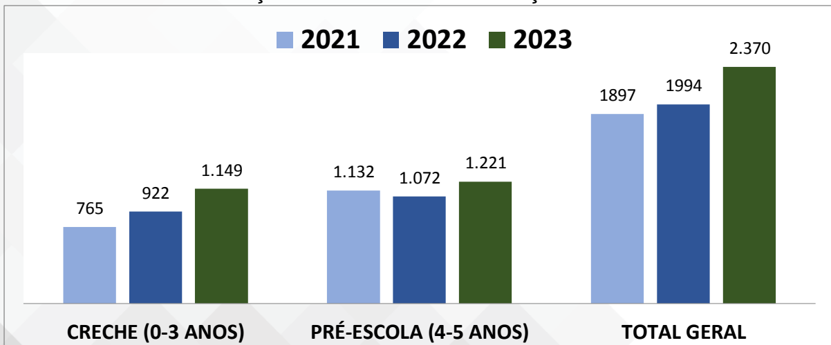
Gráfico 1 – Tucumã: Situação de matrículas da Educação Infantil entre 2021 e 2023

Fonte: INEP, Censo Escolar da Educação Básica.