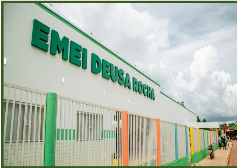
Foto: 02- Anexo a EMEI Deusa Rocha