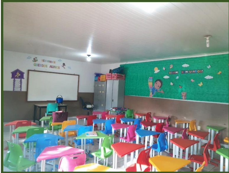
Foto: 10- Sala anexa a EMEI Machado de Assis